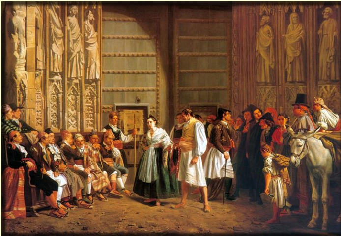
Tribunal de las Aguas by Bernardo Ferrándiz, 1865.