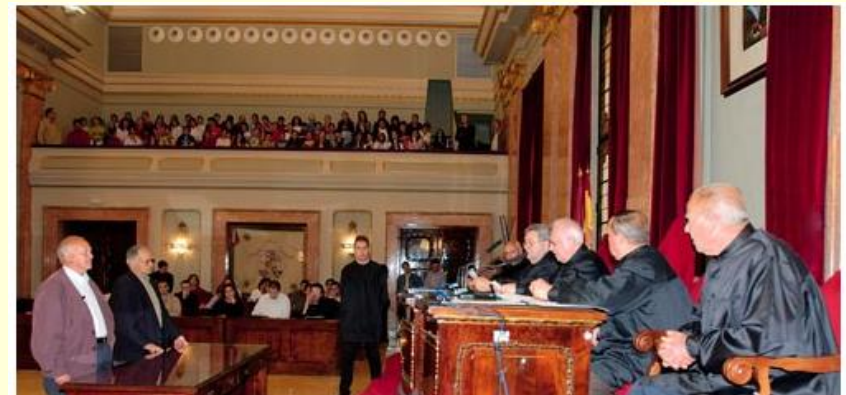
Consejo de Hombres Buenos de la Huerta de Murcia

The Council of Wise Men of the Plain of Murcia