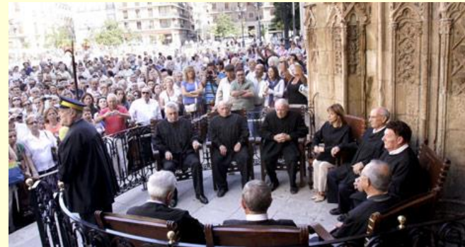
Tribunal de las Aguas